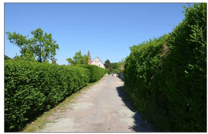
① Siedlungshecke aus nichtheimischen Gehölzen im östlichen Bereich

Diplom-Ingenieur Ulrich Zeh Lange Straße 50 18311 Ribnitz-Damgarten Tel.: 03821/390262