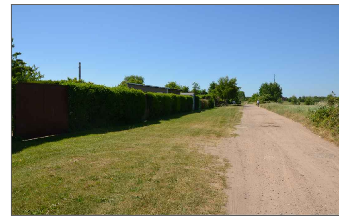
② Artenarmer Zierrasen im nördlichen Bereich