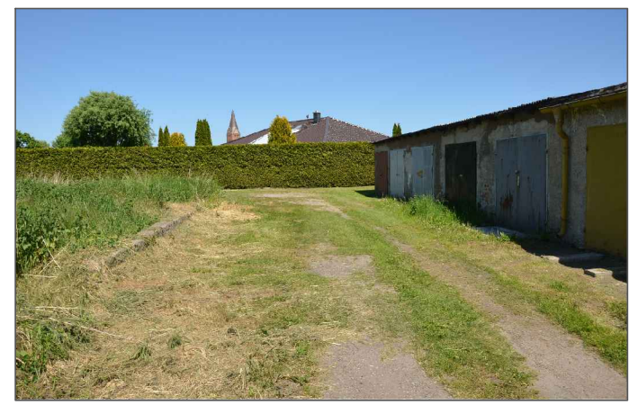
③ Ruderale Staudenflur im südöstlichen Bereich

PROJEKTNAME Stadt Barth Bebauungsplan Nr. 32 II "Weidenweg"