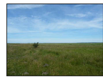
7 Feuchtgrünland im Nordwesten