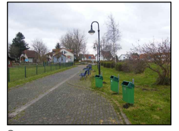
6 Blick aus Richtung des Steges ins Ferienhausgebiet