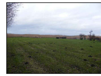
3 Freizeifläche nordwestlicher Bereich