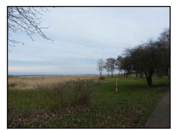
8 Parkfläche westlich des Plangebietes

PROJEKTNAME Gemeinde Fuhendorf Bebauungsplan Nr. 20 "Floating Houses Fuhendorf"