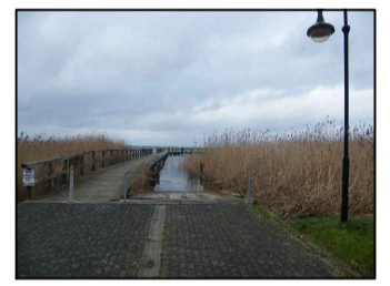
4 Steganlage im Norden