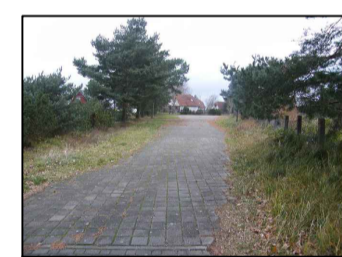
1 Parkplatze im südöstlichen Bereich