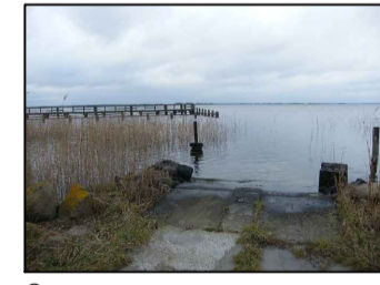
5 Slipanlage im östlichen Bereich des Plangebietes