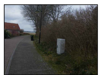
2 Gehölzfläche im östlichen Bereich